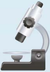
Clínicas & Laboratórios