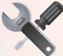
Prestadores de Serviços