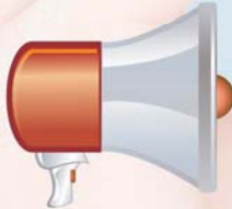
Marketing & Vendas