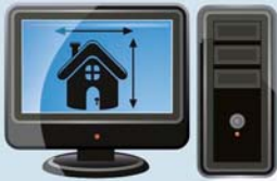
Tecnologia & Multimídias