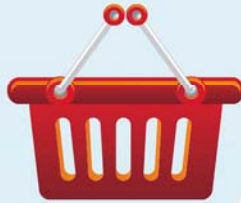
Lojas de Varejo & Atacado