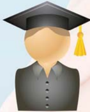
Instituições de Ensino