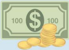
Recuperação de Crédito & Cobrança